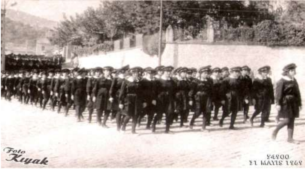
Resim 1 Buldan Ortaokulu

Okulumuzun, 1 okul müdürü, 3 müdür yardımcısı, 24 öğretmen,1 memur,1 aşçı,3 yardımcı personel, 284 öğrencisi bulunmaktadır.